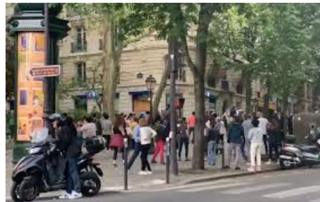
26 avril 2020 - Le Parisien

Comme le disait Alexis de Tocqueville, notre société est devenue individualiste. Mais durant le confinement, les besoins naturels des individus se sont fait ressentir. Nous avons pu voir que le sport est redevenu un but chez les individus, et le besoin de voir de la vie, d'autres gens, des amis était très important. Le lien social a donc pu être mis en avant avec ces images de personnes qui ne respectaient plus le confinement par besoin de revoir des individus, par besoin de s'amuser. Les premières réactions des gens le 11 mai, même dans un contexte de crise sanitaire comme telle, ont été de revoir leur proches par besoin de ce lien social. Nous pouvons donc déduire que les réseaux sociaux, télévisions et balcons ont été un moyen de garder un réel contact avec l'extérieur.