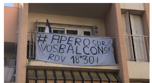
19 mars 2020 - France3 régions

Le confinement a été une épreuve rude pour la population française comme pour la population mondiale.