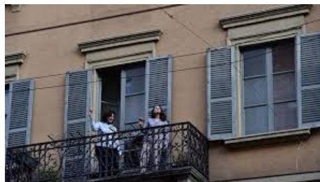
20 mars 2020 - Francebleu

Les habitants se sont réunis pour écouter de la musique ensemble et danser. Malgré les restrictions du gouvernement, les individus avaient besoin pour conserver ce lien social de franchir les limites de l'Etat.